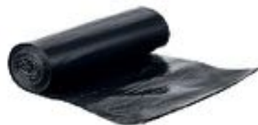
SACCHI SPAZZATURA 90x120 pz. 18