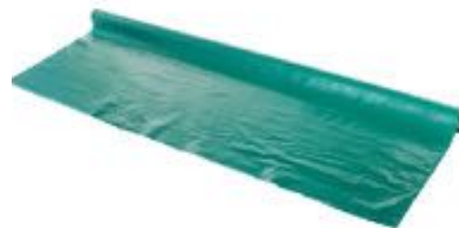
TOVAGLIA DI SERVIZIO In plastica al metro