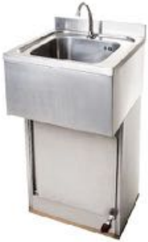
LAVAMANI INOX A PEDALE