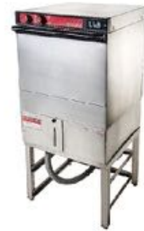
LAVABICCHIERI ANGELO PO