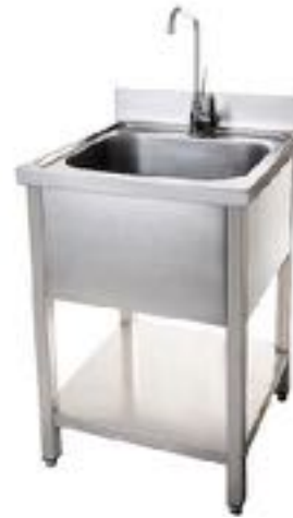
LAVELLO INOX A LEVA