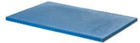
TAGLIERE IN POLIETILENE